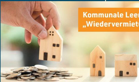
Kommunale Leerstandsaktivierung „Wiedervermietungsprämie“