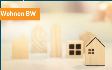
Kompetenzzentrum Wohnen BW